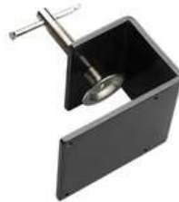
Tischklemme 0-44 mm SKU: 007-50.90