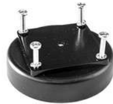
Magnetfuß SKU: 008-50.90